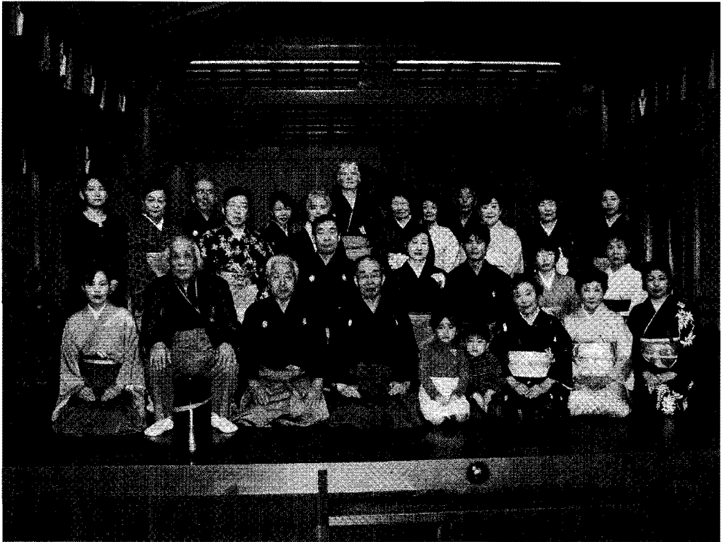
初謡会 2013.1.20 大島能楽堂 筆者 後列右から2人目