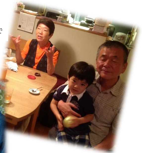
出雲先生のお家で