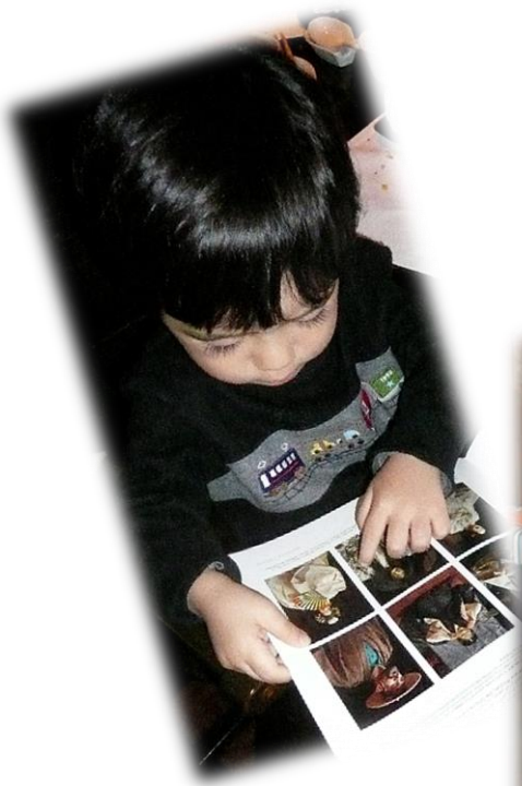
ジャンさんのお家で