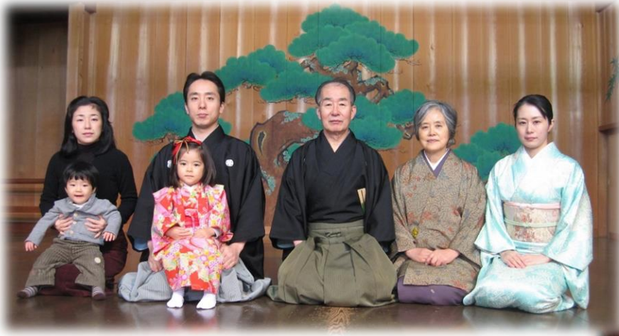
2010年元旦 喜多流大島能舞台で