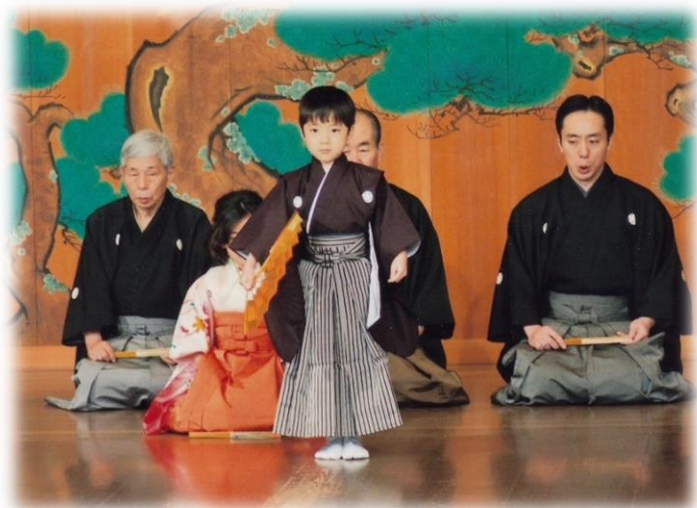
初謡会 仕舞「安宅」伊織 2015年1月18日 大島能楽堂