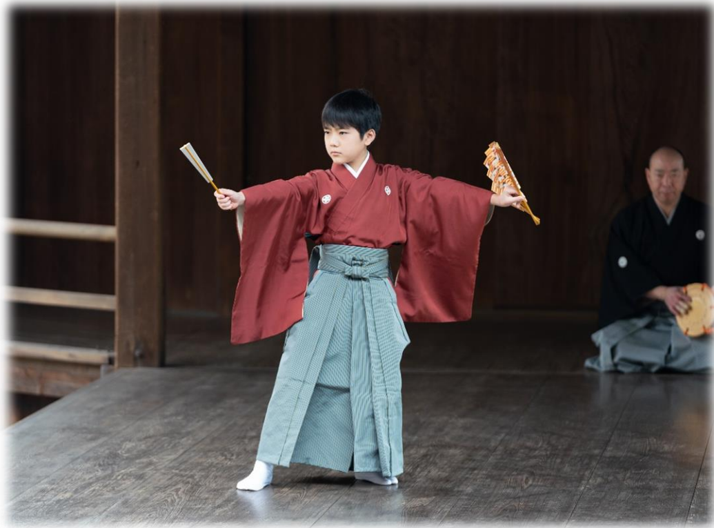
初代藩主水野勝成入封 400 年記念 鞆の浦 新春能楽祭 舞囃子「八島」伊織 2020 年 1 月 3 日 沼名前神社能舞台